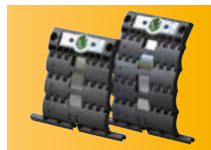
Lieferbar in 2- und 3-gliedriger Ausführung für Mini- und Maxi-Profile.